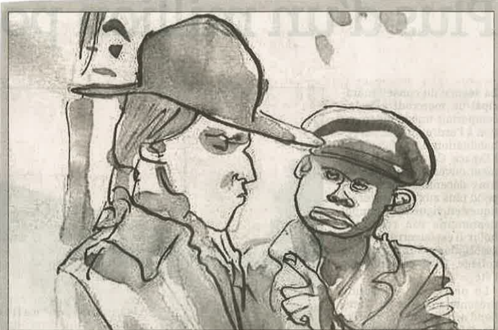
■ De la ligne claire, façon Baron Brumaire.