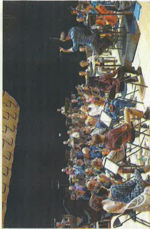
■ Première répétition pour l'OVH avant la première représentation de « Nuage Rouge » ce samedi.

■ À noter que la suite de Pierre et le loup sera jouée par l'Orchestre national de Strasbourg. « On nous a aussi demandés une version en italien ! On est contents. Nos créations vivent en dehors de l'orchestre ! » rapporte le chef d'orchestre.